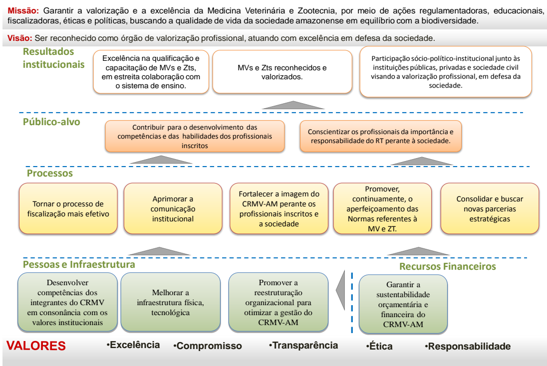
Figura 02 – Planejamento Estratégico

Contudo, é crescente o número de profissionais e empresas registradas.